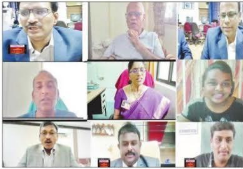
ఆన్లైన్లో విద్యార్థులతో భేటీ అయిన కళాశాల అధ్యాపకులు